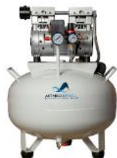
Compressor de 35L de 1,14HP modelo AM35.1