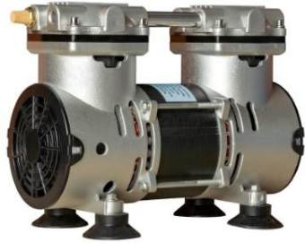
Bomba de pressão 300w modelo 89AMPRe