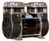
Bomba de pressão 100w modelo 51AMP