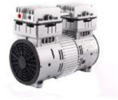
Motocompressor 1,14HP modelo 800AMPRe