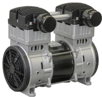
Motocompressor 2,0HP modelo 1500AMP