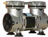
Bomba de pressão 300w modelo 89AMPRe