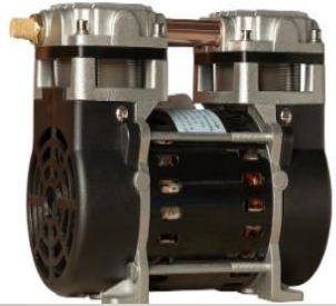
Bomba de vácuo 100w modelo 24AMP