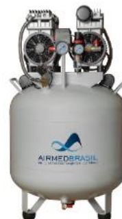
Compressor de 65L de 2,28HP modelo AM65.1