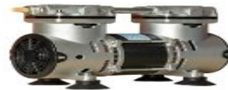
Bomba de vácuo 300w modelo 89AMP