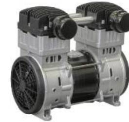
Motocompressor 2,0HP modelo 1500AMPRe