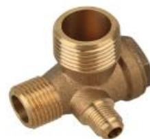
Válvula de retenção