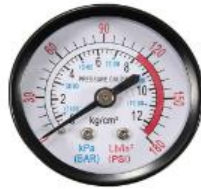
Manômetro horizontal 50mm/40mm