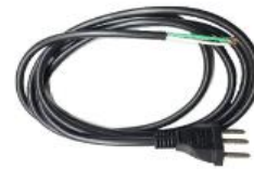
Cabo de força