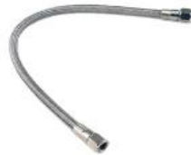
Mangueira metálica 1/4 e 1/2