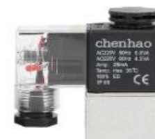
Válvula de solenóide