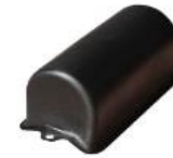
Capa do capacitor