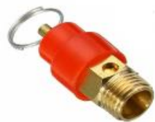
Válvula de segurança (8bar)