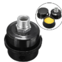
Filtro de ar