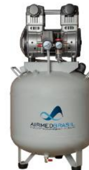
Compressor de 65L de 2,0HP modelo AM65.2