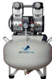
Compressor de 35L de 2,0HP modelo AM35.2