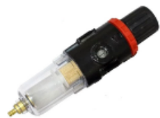
Filtro regulador 1/4