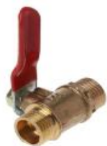
Válvula de saída