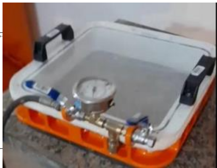
CAIXA DE VACUO PARA GEL MENBRANA